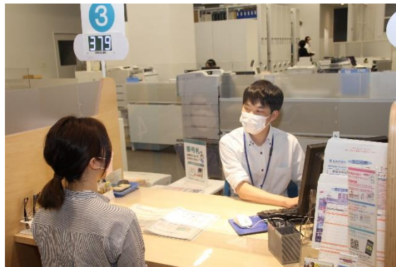
（「書かないワンストップ窓口」を活用した窓口業務）