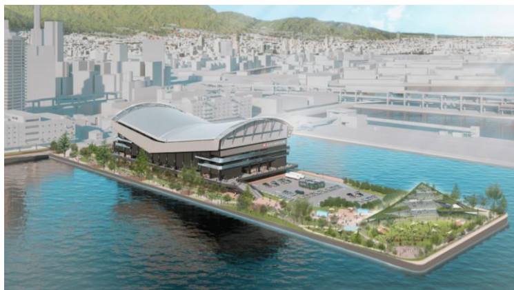
新港第二突堤エリア（愛称：TOTTEI）イメージ

One Bright KOBE は、神戸アリーナプロジェクトの運営企業として「この世界の心拍数を、上げていく。」を存在意義に、阪神淡路大震災より 30 年目の節目に誕生する GLION ARENA KOBE を基点に日常的なにぎわいづくりに取り組みます。アリーナは、開業後に B.LEAGUE 「神戸ストークス」のホームアリーナとなるほか、音楽コンサート、MICE などさまざまなイベントの開催を予定しています。